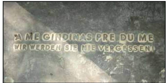
Gedenktafel im Baranka-Park, der ehemaligen „Hellerwiese“ Foto: Barbara Tiefenbacher 2010

gezäunt und in ein Sammellager umgewandelt, das nicht mehr verlassen werden durfte. Kurze Zeit später wurden das Lager liquidiert und sämtliche Bewohner deportiert. Über deren weiteres Schicksal ist nichts bekannt. Keiner kehrte lebend zurück.