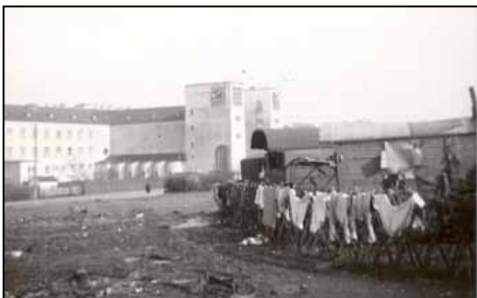
Historische Aufnahme der „Hellerwiese“ im 10. Wiener Bezirk

In Wien wurde einer der größten traditionellen Stellplätze, die „Hellerwiese“ im 10. Bezirk (heute: Baranka-Park), 1941 über Nacht von der SS mit Stacheldrahtwänden ein-