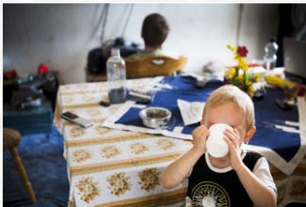
Kreative Anonymisierung: Die Tasse vor dem Gesicht.

„Das Problem ist, dass man natürlich auch mit der Familie in Verbindung gebracht wird und dass das unter Umständen sehr negative Auswirkungen haben kann. Gerade für Kinder.“*