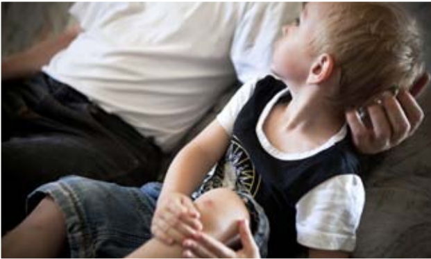
Respektvoller Umgang heißt auch Mitsprache bei Bildern.

Armutsbetroffene stehen unter existenziellem Druck, was eine sensible, empathische Herangehensweise erfordert. Armut ist mit einem Stigma verbunden. Betroffene sollten die Möglichkeit haben, auf Fragen nicht zu antworten, ihre Wohnung nicht herzeigen zu müssen, nicht mit vollem Namen im Bericht vorzukommen. Ein professionelles Umgehen mit den InterviewpartnerInnen beinhaltet eine gute Vorabinformation, ein Abklären, ab wann das Vorgespräch endet und die Interviewsituation beginnt, eine Feedbackschleife mit der Möglichkeit, Passagen oder Bilder der Veröffentlichung zu entziehen sowie eine Information nach Erscheinen des Beitrags und im Idealfall eine Zusendung des Beitrags.