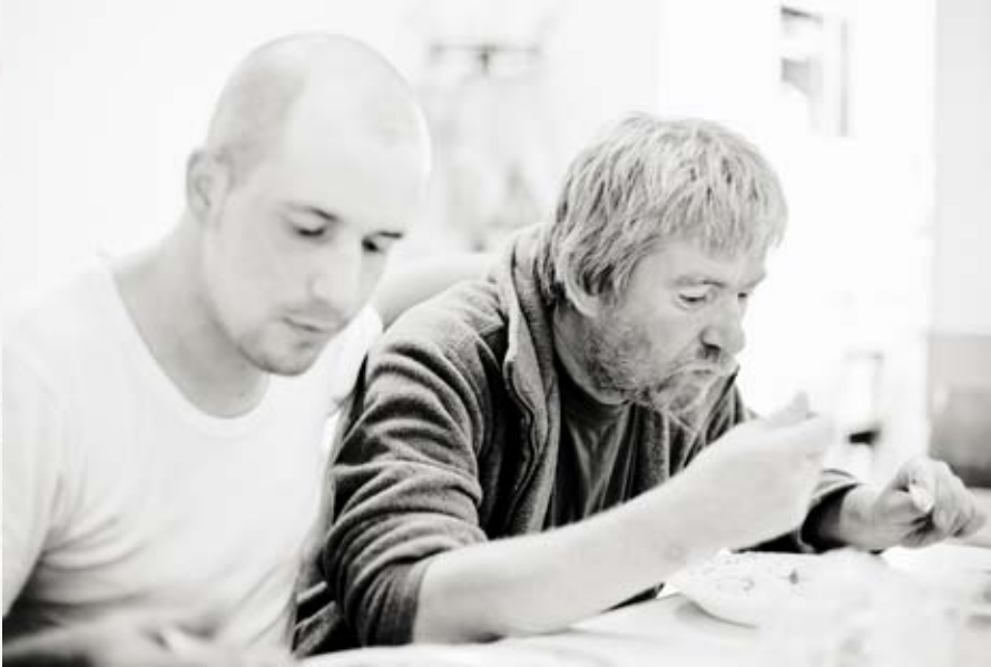
Siegerbild eines Wettbewerbs der Fotoschule Wien zum Europäischen Jahr gegen Armut und soziale Ausgrenzung 2010.