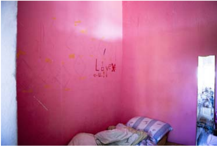
Typisches Kinderzimmer? Armutsbilder funktionieren auch ohne Menschen.