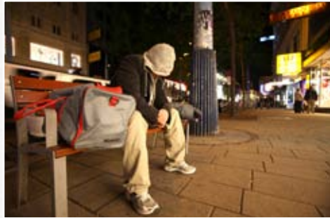
„Neue junge Obdachlosigkeit“: Artikel in NEWS im Juli 2011 von Sandra Wobrazek – Preisträgerin des Journalismuspreis „von unten“ in der Kategorie Print 2011.

Diese Broschüre soll mithilfe Armutsbetroffene als ExpertInnen zu sehen und zu Wort kommen zu lassen. Dies ist ein wesentlicher Beitrag dazu, unterschiedliche Facetten von Armut sichtbar zu machen und damit Klischees – die meist stereotype, extreme Formen von Armut zeigen – aufzubrechen.