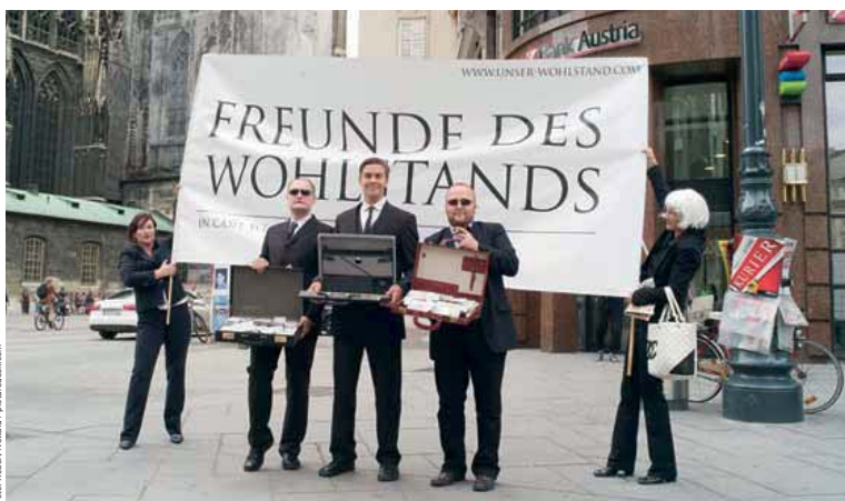
Wien, Stephansplatz, Aktion der Freunde des Wohlstands, In Cash We Trust, Bankenrettung.